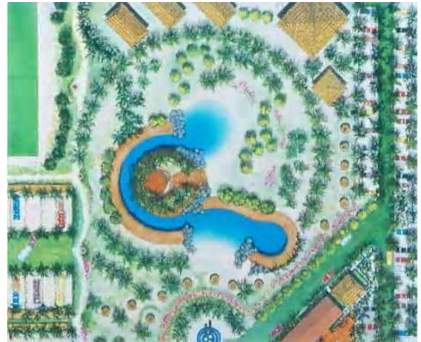
ALBERCA ZONA DE CASAS RODANTES